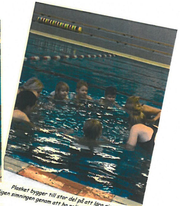
Plasket bygger till stor del på att lära sig vattnet, vanan och slutligen simningen genom att ha roligt och genom lek i vattnet.