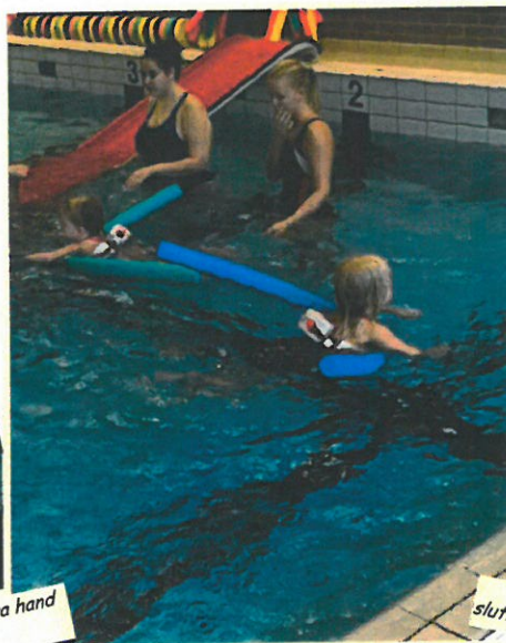
Ett av de tidiga målen i Plasket är att kunna röra sig utan flytmedel i vattnet. Men det är viktigt att inte stressa fram.