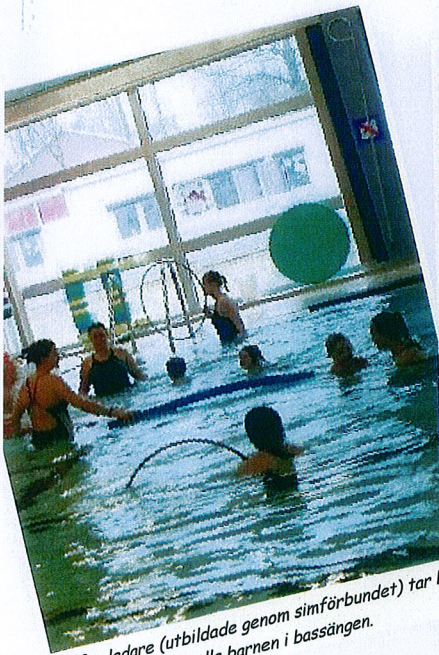
Våra ledare (utbildade genom simförbundet) tar bra hand om alla barnen i bassängen.